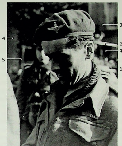
Figuur 1 Foto van Parachutist.

Maar eerst: wat zien we op de achtergrond? Ondanks dat deze wat vaag is, is er toch van alles te zien. Allereerst staan naast en achter onze Airborne militair drie Duitsers. De meest zichtbare boven zijn rechterschouder, daarnaast op de rand van de foto (links) een arm van een tweede