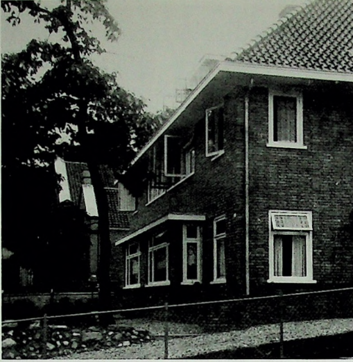
Het huis van de familie Pieterse aan de Bakenbergseweg. Op de achtergrond is een deel van het koetshuis van het landgoed De Sterrenberg zichtbaar. Die gebouwen zijn na de oorlog afgebroken.

Er gebeurde zoveel tegelijk in de lucht op die 17e september, dat er geen beginnen aan was om alles op te schrijven. Het eerste, voor zover ik me herinner, waardoor we in de gaten kregen dat de bevrijding nu wel heel erg dichtbij kwam, was het zien van een paar Britse Mosquito bommenwerpers, die op iets meer dan boomtop hoogte vanuit het westen, zo te zien de spoorlijn Ede - Arnhem volgend, richting binnenstad vlogen. Op het moment dat ze ter hoogte van Huize Rosorum aan de Amsterdamseweg waren, zagen we dat er vanonder ieder toestel twee bommen loskwamen, die zoals later bleek, op de Willemskazerne vielen. In die kazerne lag een Duits onderdeel. (Na de oorlog ontdekte men dat er een paar blindgangers van die aanval onder restaurant Royal aan het Willemsplein lagen).