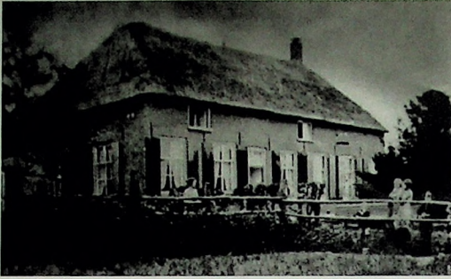
Boerderij De Laar in 1940.