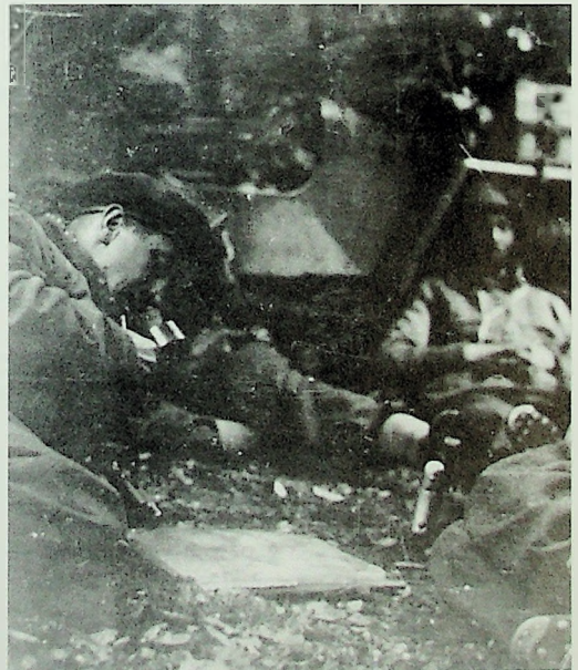
Een van de foto's die Captain Jasper Booty met zijn privé camera maakte tijdens de tocht van de 4e Brigade door de bossen ten noordwesten van Oosterbeek. Links Brigadier Hackett met in zijn hand een microfoon van een zendontvanger. Voor hem op de grond een kaart van het operatiegebied. Op de achtergrond een jeep waartegen enkele mannen zitten.

A-compagnie van het 156e Bataljon ontmoette hier sterke tegenstand door mitrailleurvuur vanuit westelijke richting. C-compagnie deed een aanval naar rechts, om de splitsing Utrechtseweg-Breedelaan veilig te stellen, maar stuitte op nog sterkere Duitse eenheden, waaronder gemotoriseerd geschut, en werd ongeveer