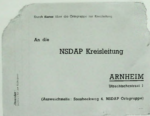
Afbeelding 7. Voorbedrukte 'briefkaart' van de NSDAP (uit particuliere collectie).

Met enig inbeeldingsvermogen kan men op een sterk uitvergrote versie van afbeelding 1 op het bordje onder het NDSAP-bord ook een aantal letters herkennen die te tekst 'Kreisleitung' en daaronder 'ARNHEIM' zouden kunnen vormen.