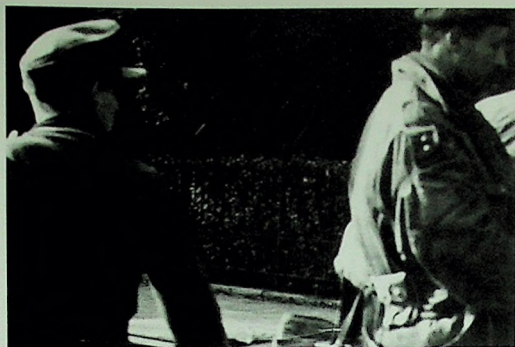
Afbeelding 4. Detail 1011-497-3530-15A.

De aan het bovineinde schuin naar achteren gebogen staanders, de heg, het randje op de stoep, en (voor wie goed kijkt) zelfs de twee horizontaal gespannen (prikkel-?)draden tussen de schuine staanders zijn identiek. De locatie van afbeelding 4 was al wél bekend: deze is genomen op de kruising Utrechtsestraat-Bergstraat, in zuidwestelijke richting.