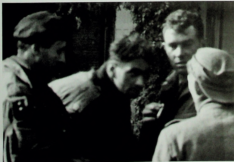
Afbeelding 13. Detail van bild 1011-497-3530-15A.