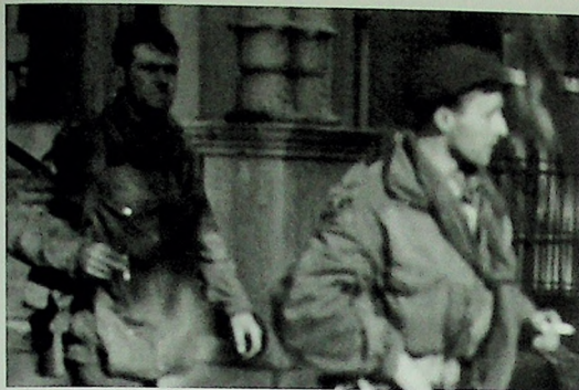
Afbeelding 12. Twee details van bild 1011-497-3530-14A.

en wat deden zij daar? Zijn dat hun fietsen? Of zijn het de fietsen van Wafen-ss-ers van de 9e SS Panzer-Division Hohenstaufen die hier gevochten hebben? Bekend is dat een aantal onderdelen op 17 september op de fiets naar Arnhem zijn gekomen. Zou het pand Utrechtsestraat 1 een lokaal hoofdkwartier van de hier vechtende Duitsers geweest kunnen zijn?