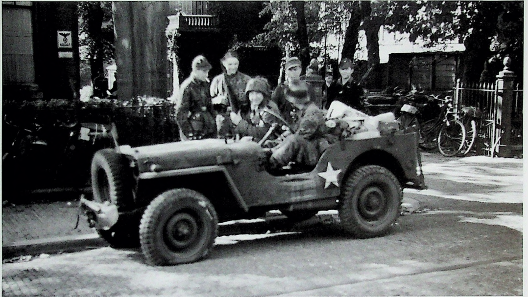
Afbeelding 1. Bild 101I-497-3531-11.

Bijlage bij Nieuwsbrief No. 118 van de Vereniging Vrienden van het Airborne Museum Oosterbeek, juni 2010