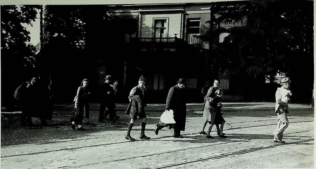
Afbeelding 6. Bild 1011-497-3526-22A.