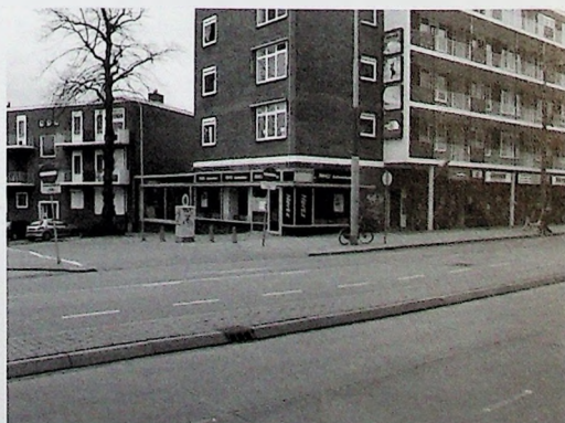
Afbeelding 11. De plek van afbeelding 6 anno 2010.