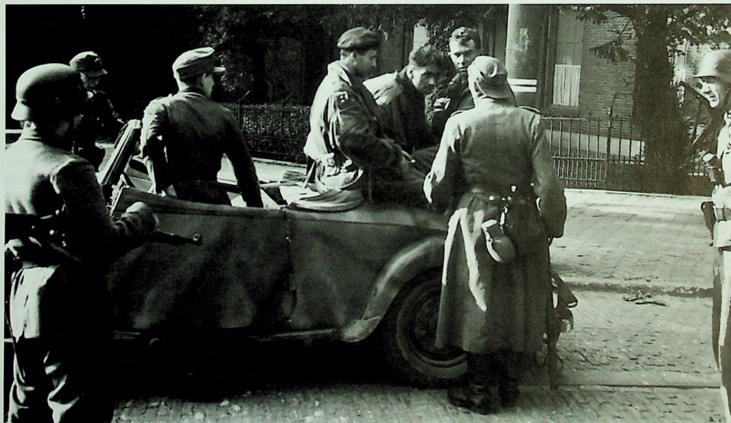
Afbeelding 5. Bild 1011-497-3530-15A.