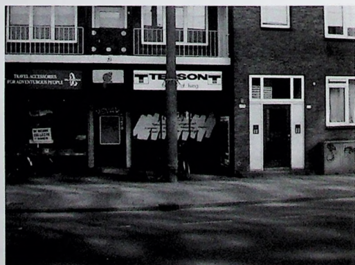
Afbeelding 10. De plek van afbeelding 1 anno 2010.