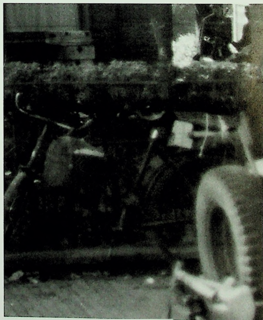
Afbeelding 3. Detail 1011-497-3531-11.