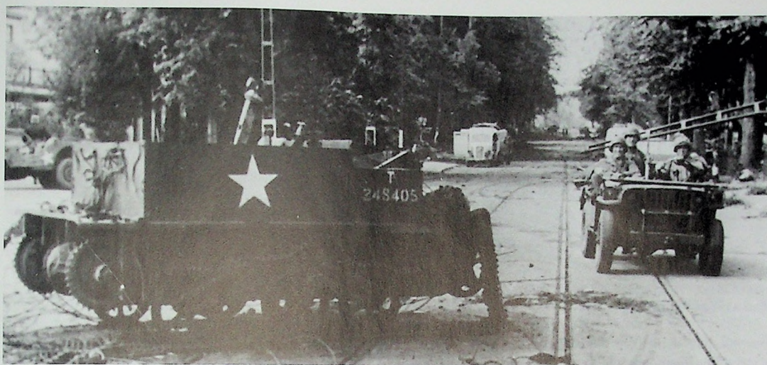
Na de slag passerende Duitse soldaten in een buitgemaakte jeep op de Utrechtseweg in Oosterbeek een kapotte Bren carrier, die waarschijnlijk behoorde bij het 10th Parachute Battalion. De foto werd gemaakt door PK fotograaf Adendorf, ca. honderd meter oostelijk van het kruispunt van de Utrechtseweg en de Stationsweg. (foto: collectie Robert Voskuil)

het zou erg moeilijk zijn geworden om vanuit het zuiden de troepen bij de brug te versterken. Frost veranderde van gedachten en het plan ging niet door. Freddy Gough merkte later op: 'De kans van slagen was miniem en het zou de familie Gough haar vierde Victoria Cross hebben opgeleverd, maar wel postuum en zonder enig nut. De carrier werd later gebruikt door de Duitsers. Dit gebeurde toen de strijd in de ochtend van 21 september op zijn eind liep. Met de carrier werden de gewonden weggehaald uit de steeds kleiner wordende perimeter. Het schijnt dat de Duitsers geen problemen hadden met het rijden met de carrier, omdat ze veel van deze voertuigen hadden buitgemaakt in de zomer van 1940.