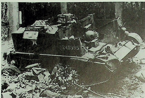
De Duitse Luftwaffe PK fotograaf Lutz Koch fotografeerde na de strijd een van de twee Bren carriers van 7 KOSB.