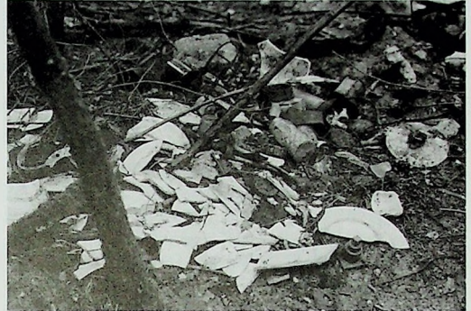
Door schatgravers opgegraven en achtergelaten vondsten in een Flak-stelling ergens op de zuidwestelijke Veluwe. Opvallend is de grote hoeveelheid huisraad (foto Ruurd Kok, juni 2005).

Deze luchtafweerstelling is slechts een van de vele terreinen met resten uit de oorlog waar zoekers vooralsnog ongestoord hun gang kunnen gaan. Slechts weinig mensen lijken zich ervan bewust te zijn, dat zodoende een unieke en onvervangbare informatiebron wordt vernietigd. De betekenis van bodemvondsten als historische bron lijkt nog vrijwel onbekend. Dat geldt ook voor berichten in deze Nieuwsbrief. In nummer 97 (februari 2005) wordt bijvoorbeeld de vondst beschreven van een dropkooi voor een motorfiets te Driel (Versluijs 2005) en is ook een bericht opgenomen over een zeldzaam stengun-bajonet die bij de Ginkelse Heide werd gevonden. De betekenis van deze vondsten wordt vooral gezien als een welkome, zeldzame aanvulling op de collectie van het Airborne Museum respectievelijk een particulier. De betekenis van bodemvondsten gaat