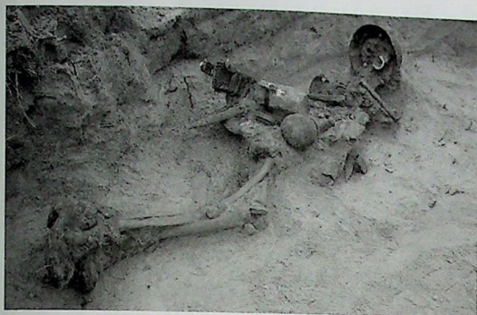
De Bergingsdienst legt de resten bloot van een Duitse soldaat, die in februari 2006 zijn aangetroffen bij werkzaamheden aan de westzijde van de spoorlijn Arnhem-Nijmegen ter hoogte van de wijk Schuytgraaf (foto Gravendienst/BID).

Oosterbeek is in 2005 als eerste beschermd object op de lijst van gemeentelijke martiale monumenten geplaatst. xvi Ook herkenbare sporen in het landschap komen hiervoor in aanmerking.