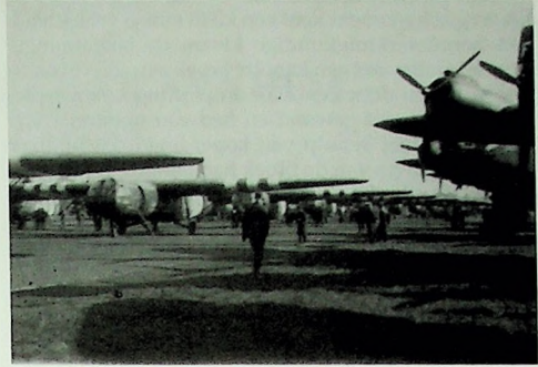
Horsa gliders en Stirlings worden op Keevil in gereedheid gebracht. Het is mogelijk dat deze foto op 19 september 1944 is gemaakt, en dat zou betekenen dat onder andere Poolse zweefvliegtuigen, bestemd voor de Johannahoeve, zijn te zien.

We bleven echter op onze hoede, want er konden altijd Duitse jachtvliegtuigen opduiken! Een van de vliegtuigen van ons squadron was een maand eerder neergeschoten toen hij terugkwam van een missie en op het punt stond te landen op onze basis. De staartschutter had zijn positie verlaten nadat ze de Engelse kust waren gepasseerd, en dus ontmoette de vijandelijke jager geen enkele tegenstand.