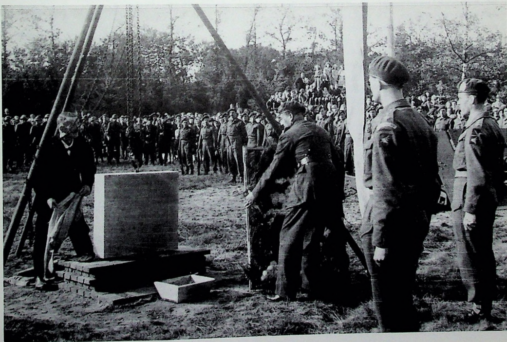
Eerste steenlegging Airborne Monument, Oosterbeek, 25 september 1945.