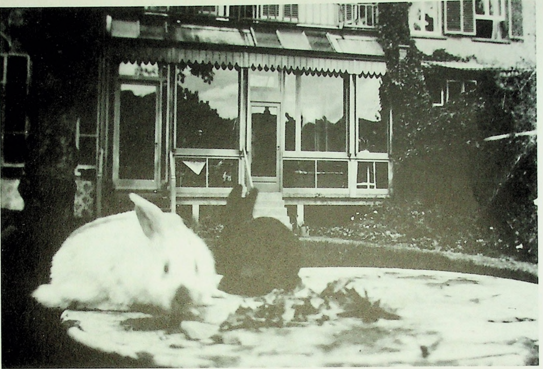
De achtertuin van pension Veenhuijsen in 1942. Duidelijk is de schuilplaats onder de serre te zien. De fotograaf stond tegen de tuinmuur, die de afscheiding vormde met de tuinen van de huizen aan de Rijnkade. Let op de knoestige kastanjeboom links.

Die middag vertelde de luitenant dat de toestand slecht was en dat de versterkingen hen niet konden bereiken. Rechts en links van het huis stonden huizen die in gebruik waren bij de politie. De Britten in het pension klommen over de tuinmuren en haalden daar meel, kool, aardappelen en een stuk vlees. Het westelijk deel van het huizenblok was toen alweer in Duitse handen, evenals de huizen aan de overkant. Duitse sluipschutters hadden zich overal verschanst.