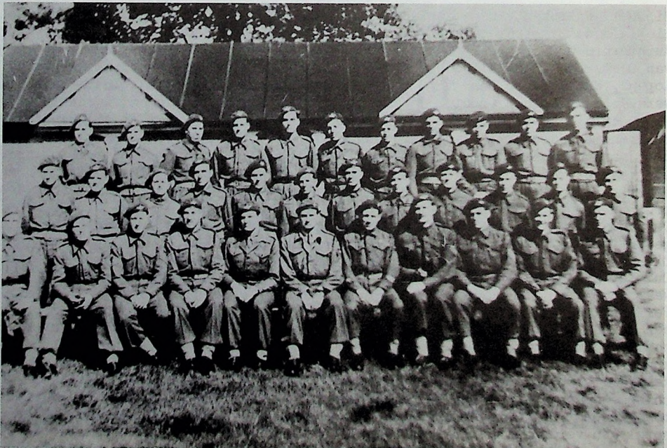
Het 6e peloton, S Compagnie, 1e Parabataljon, september 1944.

Om één uur in de middag sprong het rode licht boven de deur op groen en landde het peloton behouden bij Wolfheze. Eenmaal ontdaan van het parachute-harnas verzamelden wij ons bij de groene rookpotten van het 1e Bataljon en vormden we een verdedigingslinie rond de bossen van Wolfheze. Binnen een half uur zagen we het 2e Bataljon optrekken langs de zuidelijke route naar Arnhem en het 3e Bataljon langs de middelste, maar ons bataljon bleef in afwachting van orders ter plaatse. Tweeënhalf uur later kwam het bevel en trokken we in noordelijke richting over de spoorlijn bij Wolfheze met de R Compagnie aan de spits. Bij het oversteken van de spoorbaan werden we door zware machinegeweren en mortieren van de Duitsers onder vuur genomen. Daarna trok het bataljon ongeveer 3 km. in de richting van de weg Ede-Arnhem, waar we Duitse tanks tegenkwamen. Het bataljon was genoodzaakt in zuidelijke richting het bos in te gaan, wat met onze zware uitrusting maar moeilijk ging. Toen het donker werd stopten we. Om elf uur werd een zware Duitse aanval op R Compagnie ingezet, waardoor deze ernstige verliezen leed. Het hoofdkwartier stuurde de plaatsvervangend bataljonscommandant op onderzoek uit, maar deze sneuvelde toen zijn voertuig opgeblazen werd. Een tweede officier volgde, maar hem trof hetzelfde lot.