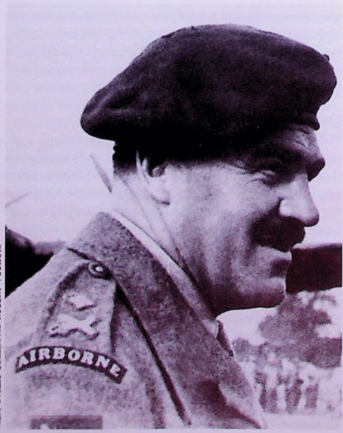
17 september 1944. Generaal R.E. Urquhart, commandant van de 1st British Airborne Division, wacht op vliegveld Fairford op het moment dat hij in een Horsa glider zal stappen om te vertrekken naar Nederland.