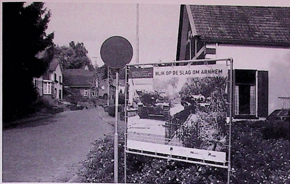
Aan de Beneden-Weverstraat in Oosterbeek stond tijdens de Airborne Wandeltocht een van de borden met een grote foto van dezelfde locatie tijdens de Slag om Arnhem.

de route gezet. De borden met de afbeeldingen bleven staan tot eind september, zodat ze ook tijdens de Airborne herdenking konden worden bekeken.