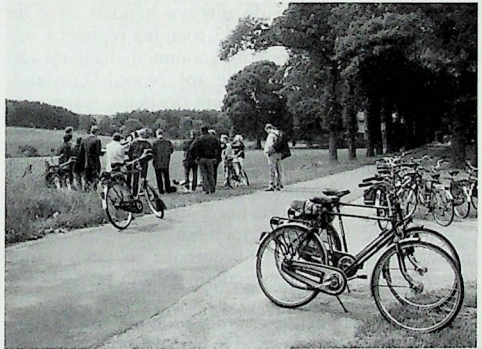
Op de Johannahoef wordt uitleg gegeven tijdens de fiets-excursie van 13 juni jl..