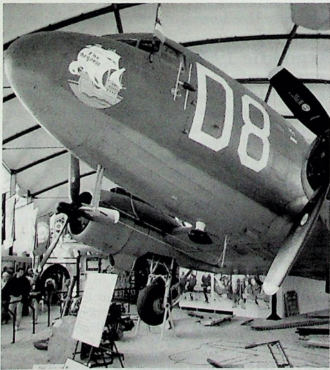
Een Douglas C-47 Skytrain (door de Britten 'Dakota' genoemd) in het Airborne Museum in Ste. Mère Église. Dit is een van de musea die tijdens de excursie naar Normandië in mei 1999 zullen worden bezocht.

Nadere informatie over deze excursie kunt u vinden op een inschrijvingsformulier dat bij deze nieuwsbrief is ingesloten.