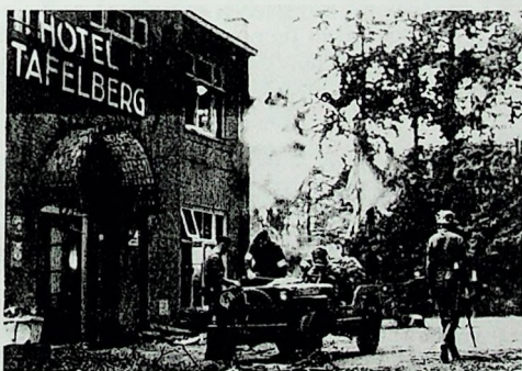
Zomer 1945. Bij Hotel de Tafelberg in Oosterbeek worden opnamen gemaakt voor de film 'Theirs is the Glory'. Zie de oproep elders in deze Nieuwsbrief.

Na afloop van de vergadering zal een film over de Slag om Arnhem worden vertoond.