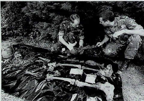
Twee militairen van de Bergings- en Identificatiedienst van Koninklijke Landmacht, verzamelen de stoffelijke resten van een gesneuvelde Britse militair, die op 7 juli 1997 bij graafwerkzaamheden werden gevonden langs de Van Lennepweg in Oosterbeek.

Zowel het Airborne Forces Museum in Aldershot als het Imperial War Museum in Londen hebben hun medewerking toegezegd. De streefdatum voor de samenstelling van de werkgroep is eind september. Het Airborne Museum 'Hartenstein' doet gaarne een beroep op belangstellende leden van de Vereniging om aan dit project deel te nemen. Voor nadere informatie kan contact worden opgenomen met de heer W. Boersma, Binnenhof 38, 6715 DP Ede, telefoon (0318) 639633 of (026) 3337710 (Airborne Museum).