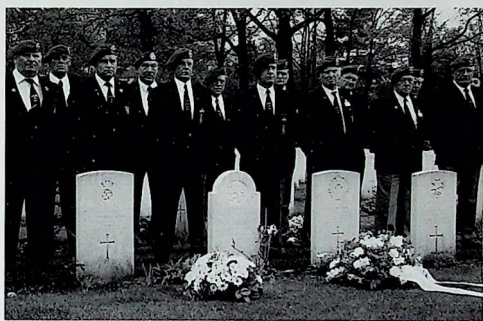
Op 5 mei 1997 wordt op de Airborne Begraafplaats in Oosterbeek een korte plechtigheid gehouden bij het van een nieuwe steen voorziene graf van de Nederlandse commando August Bakhuis Roozeboom.

De Commonwealth War Graves Commission ging uiteindelijk akkoord met de conclusie van Jan Heys rapport. Een nieuwe grafzerk werd gemaakt en geplaatst, die op 5 mei jl. tijdens een korte plechtigheid werd ingewijd. Hierbij waren o.a. Nederlandse familieleden van Bakhuis Roozeboom, en twintig veteranen van No. 2 Dutch Troop aanwezig.