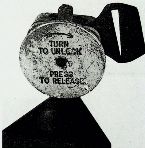
Een van de geschenken die leden kunnen verdienen door de verkoop van tien of meer loten in de loterij, is een originele 'klok' van een parachute harnas uit 1944.