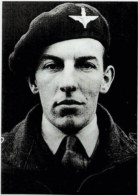
Majoor Digby Tatham-Warter in 1944.

Voor zijn gedrag tijdens en na de Slag om Arnhem ontving Digby Tatham-Warter een hoge Britse onderscheiding, de Distinguished Service Order.