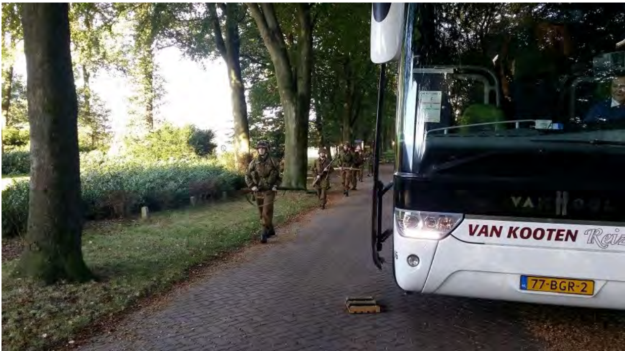
Borderes in slagorde

Daarna reden we met de bus over de Duitsekampweg naar Renkum. In de bus zagen we de Borderers van de WDLH lopen over de Duitsekampweg. Levensrecht uitgebeeld.