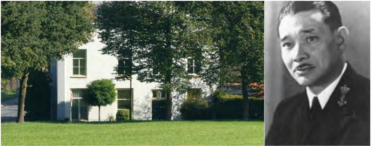
Van Daalen huis onderduikplaats van Douw van der Krap

Even verderop, nummer 5, een boerderijencomplex, was de commandopost van B Coy. Verder naar het zuiden richting de Rijn bevond zich een sectie van het 14 e peloton onder leiding van Corporal Hunter. Net west van het restaurant de Westerbouwing waren de andere twee secties van het 14 e peloton ingegraven. Dit 14 e peloton stond onder bevel van Sergeant Watson.