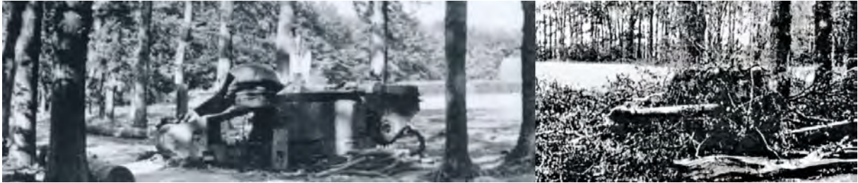
De Char B tank aan de Sonnenberglaan die werd uitgeschakeld door de Britse 17 pponder (rechts)