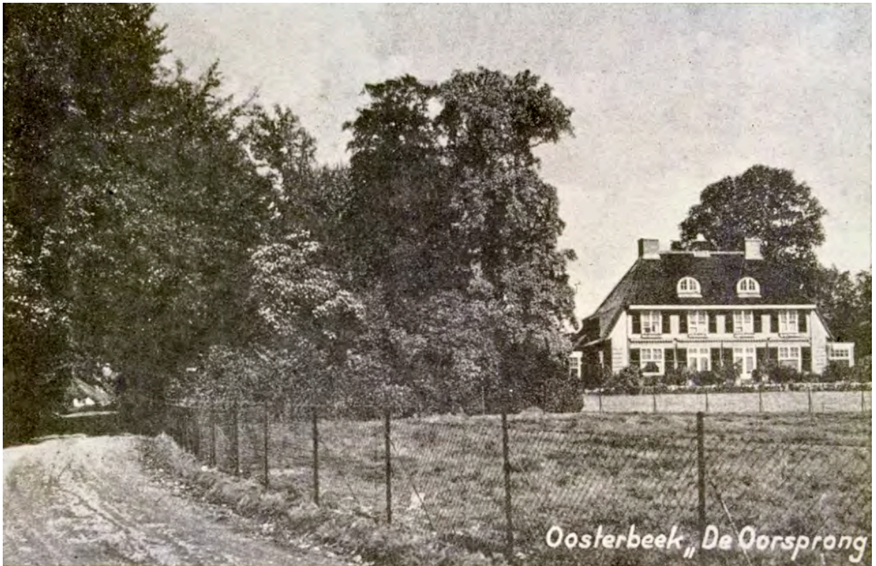
Huize De Oorsprong dat tijdens de Slag om Arnhem volledig werd verwoest.