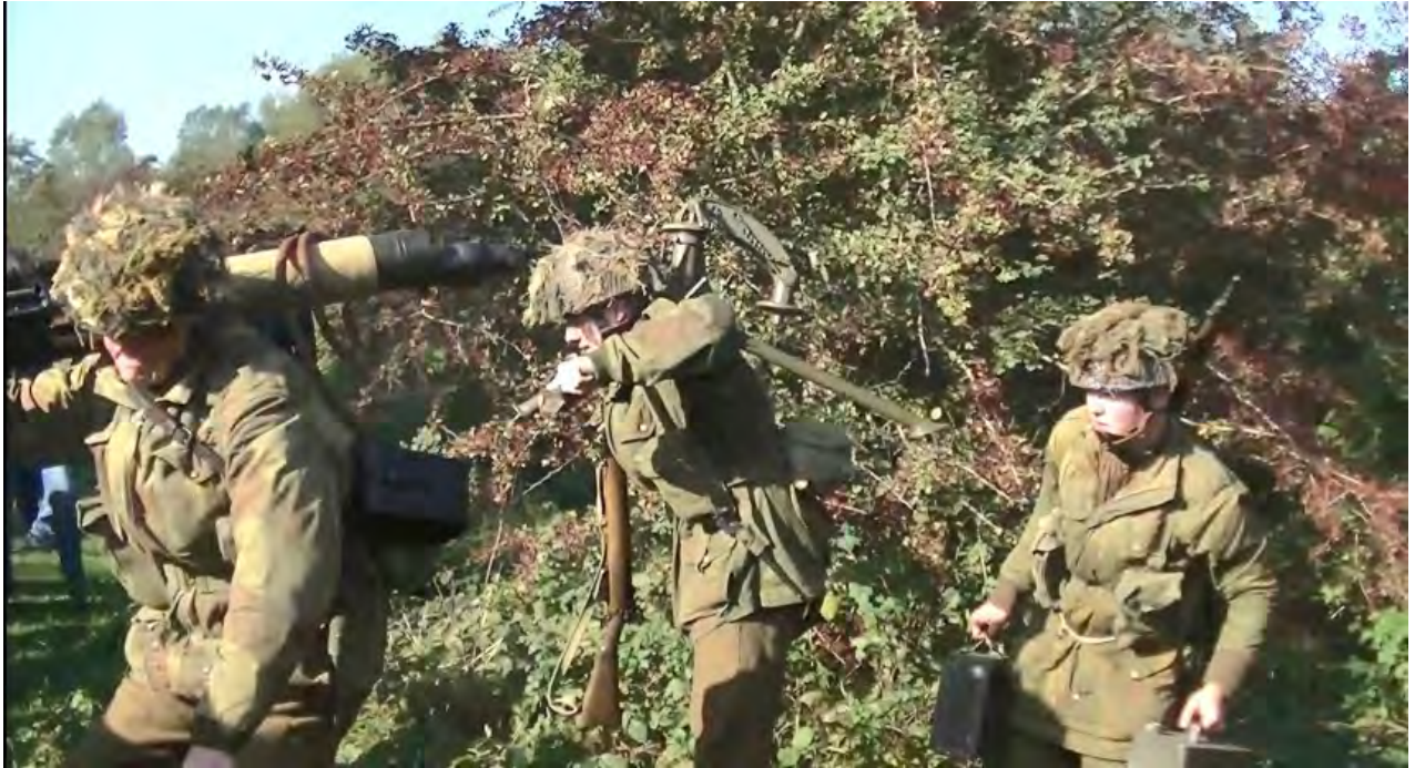
Vickers machinegeweer in draaglast

Vervolgens gingen we naar de Westerbouwing waar we uitzicht hadden op de Rijn en aan de overkant op de toren van Driel en verder op de spoorbrug bij Arnhem. Aan de gevel van het restaurant op zagen we een plaquette dat herinnert aan de officieren en manschappen van The 1st Battalion The Border Regiment.