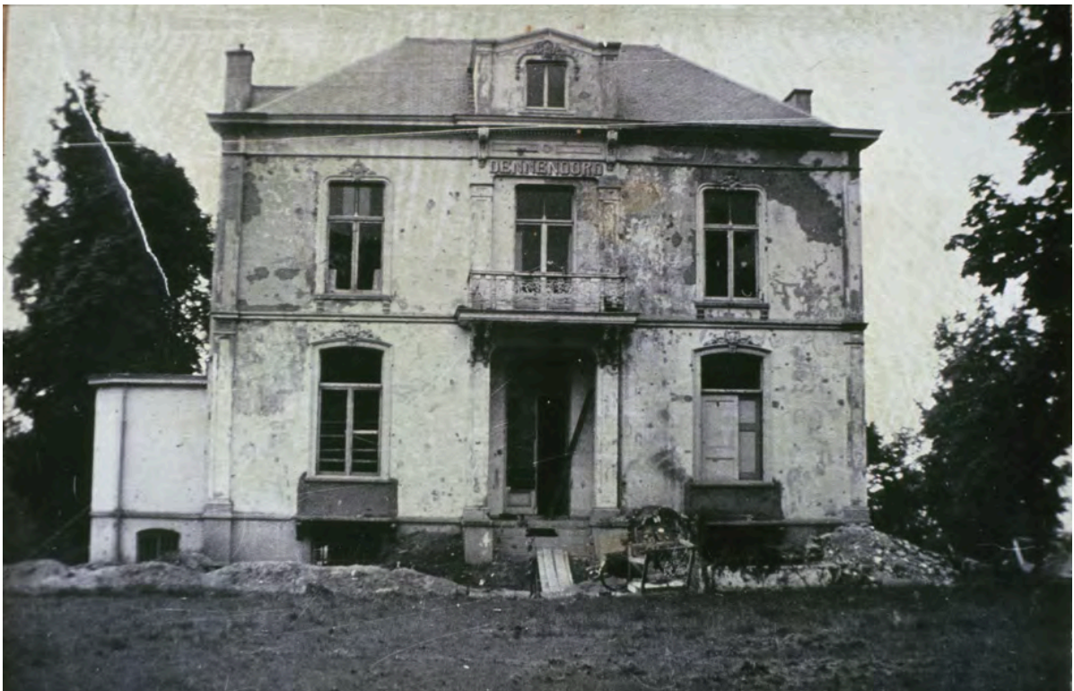
De zwaar beschadigde villa Dennenoord aan de Benedendorpseweg te Oosterbeek, in de laatste verdedigingslinie van het 1st Border Regiment.

Tenslotte komen we op de laatste verdedigingslinie van het 1st Border Regiment op de locatie van Huize Dennenoord aan de Benedendorpseweg. Dennenoord was tijdens de gevechten een verbandpost en werd zwaar beschadigd. In de jaren '70 is het gesloopt waarna er een villaparkje is gebouwd. Hier vandaan werd met wat er nog over was aan manschappen teruggetrokken naar de Rijn die met bootjes werd overgestoken in de nacht van 25 op 26 september 1944 tijdens operatie Berlin.