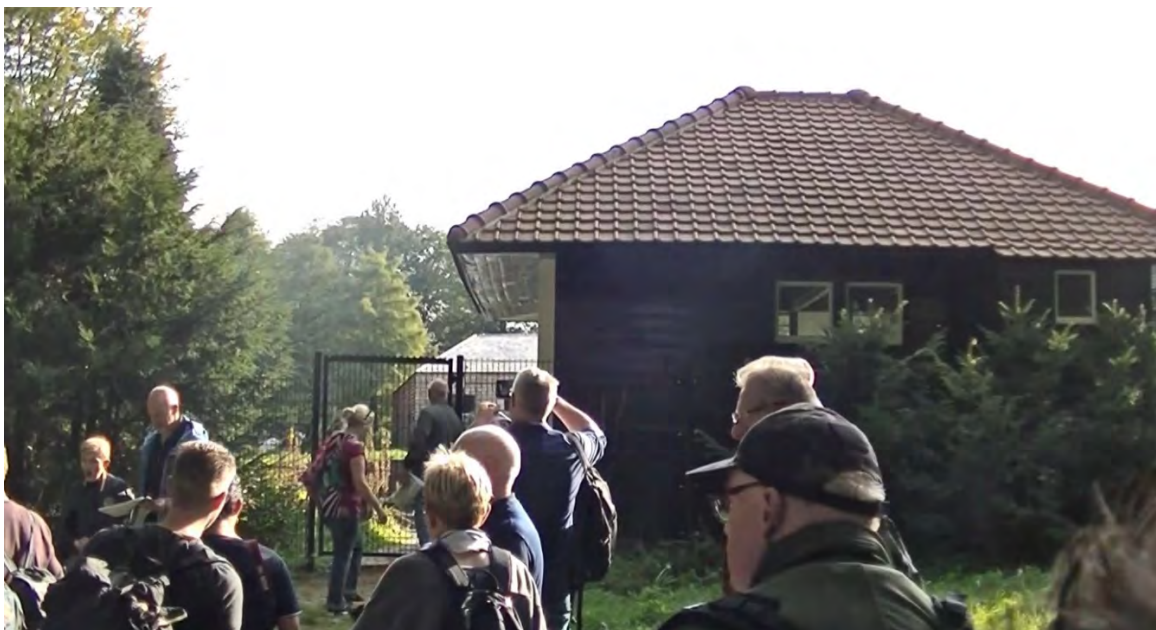
Zwembad De Oorsprong

We zien het zwembad dat bij het landhuis hoorde en na een periode van verval weer is hersteld en lopen langs de moestuinen waar zich ook nog een schuilbunker bevindt die door de laatste eigenaar is gebouwd.