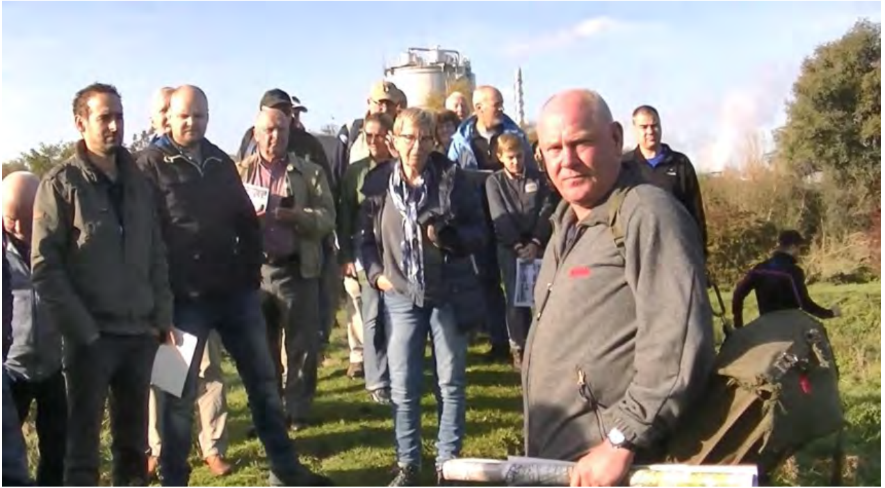
Uitleg op de kleibult bij de steenfabriek in de Jufferswaard

Op deze kleiberg had het 14 e peloton van het Border Regiment posities ingenomen. Na de geallieerde landingen ging de 10 e Schiffs-stamm-Abteilung op de fiets vanuit de Betuwe naar de Grebbeberg bij Rhenen. De 4 e compagnie van deze eenheid ging in de aanval op de steenfabriek, gesteund door geschut gemonteerd op half-tracks, de zogenaamde Stummels, bemand door SS'ers. De 14 e compagnie van het Border Regiment koos het hazenpad. Doordat de weg door de Duitsers versperd was werd besloten het anti-tankgeschut achter te laten en de Vickers mitrailleurs in draaglast over de schouder mee te nemen en onder dekking van de dijk weg te rennen naar de Westerbouwing. Deze actie werd voor ons visueel gemaakt door re-enactment.