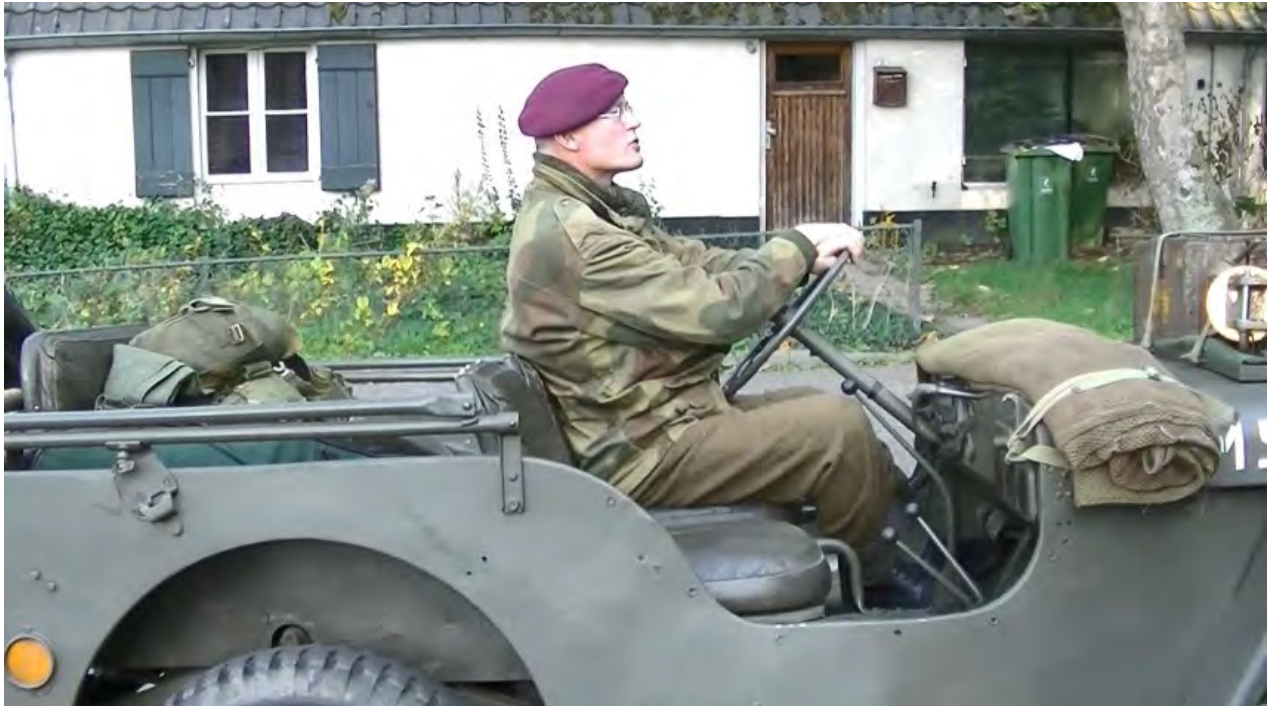
In deze boerderij bevond zich het hoofdkwartier van D Company van het Border Regiment.

Aan de Van Borsseleweg staat een oude boerderij, In 1944 tijdens de slag om Arnhem hoofdkwartier en verbandpost van D Company van The Border Regiment.