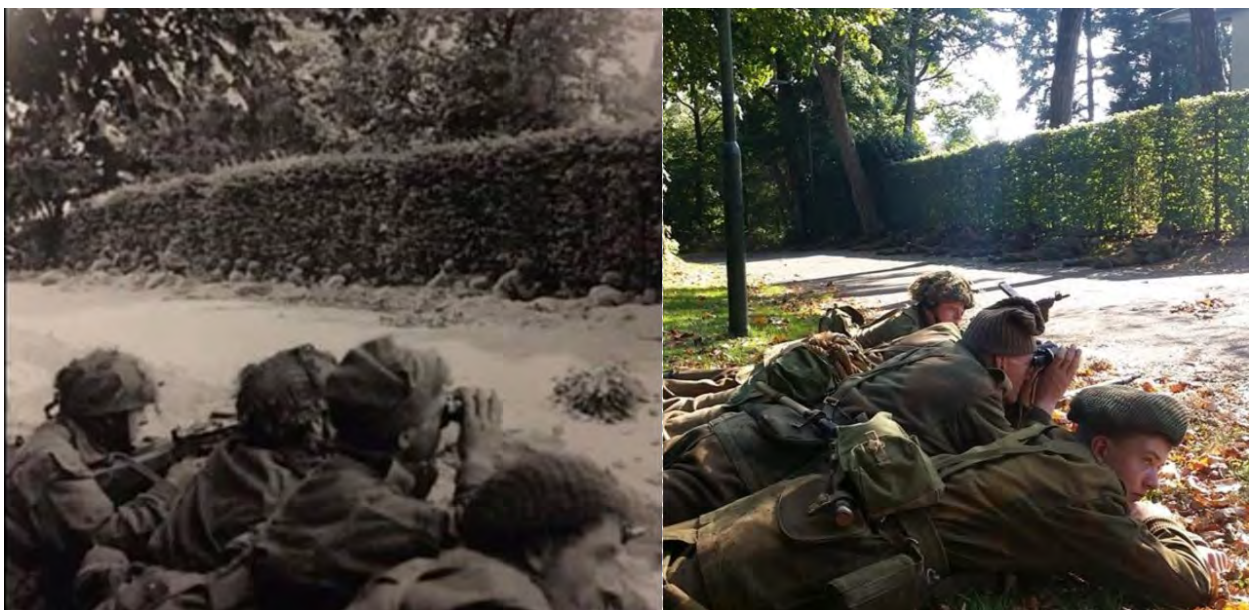
Toen en Nu: "In stelling aan de Van Lennepweg"

Het middagprogramma begon aan de Van Lennepweg waar door Linving History exact werd uitgebeeld hoe de mannen van het 15 e en 16 e peloton van C company in stelling lagen.