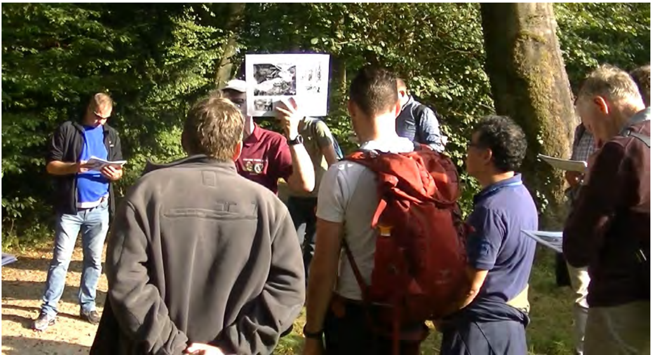
Uitleg op de Oorsprong

In het kader van het onderwerp “Burgers in de Frontlinie” vertelt onze gids Luuk Buist over zijn grootouders die naar de Oorsprong zijn gevlucht om te ontkomen aan de hevige strijd in Oosterbeek. Zij hadden geen kelder om in te schuilen en zochten een goed heenkomen. Aanvankelijk in een boerderijtje, maar vervolgens bij een boom aan de rand van een zogenaamde “sprengkop” waar zijn grootvader zwaar gewond raakte. Grootmoeder en de kinderen vluchtten weg. Hij overleed ter plekke. Pas na de oorlog is zijn grootvader op deze plaats teruggevonden. Zijn verhaal brengt de oorlog heel dichtbij.