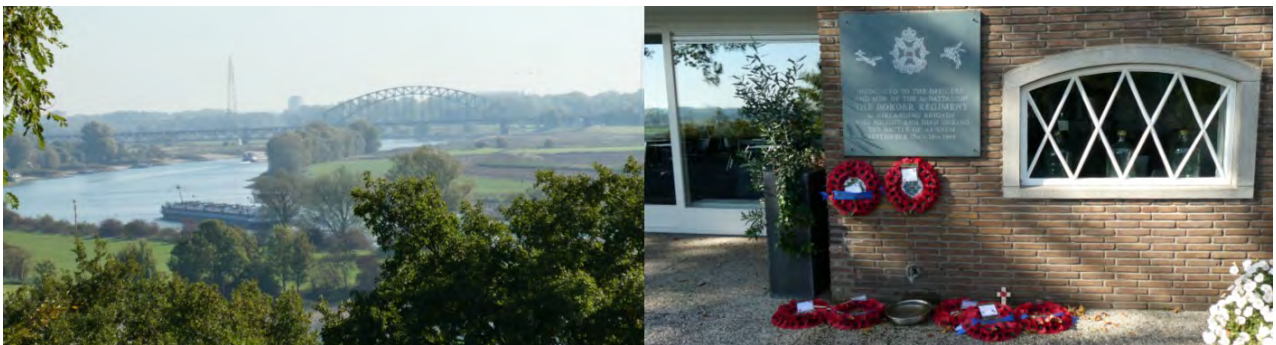
Uitzicht op de spoorbrug en plaquette op de Westerbouwing

Vervolgens gingen we naar de Westerbouwing waar we uitzicht hadden op de Rijn en aan de overkant op de toren van Driel en verder op de spoorbrug bij Arnhem. Aan de gevel van het restaurant op zagen we een plaquette dat herinnert aan de officieren en manschappen van The 1st Battalion The Border Regiment.