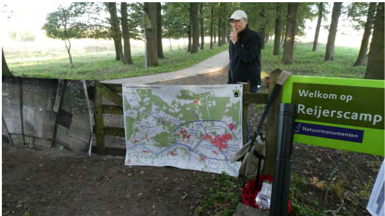
Start van de tour

We begonnen de tour bij de Reijerskamp , gelegen in Wolfheze. Daar bevond zich Landing Zone 'S' van de Britse 1 e Air Landing Brigade.