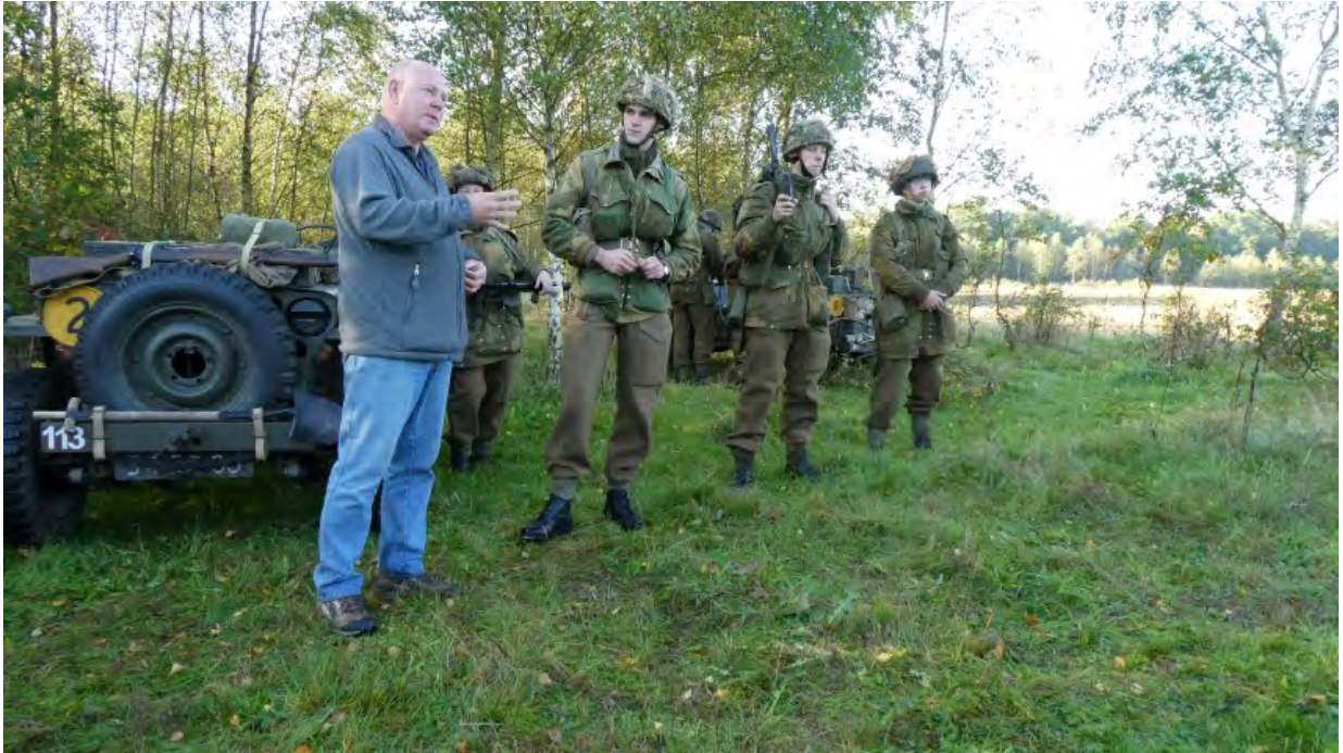
Uitleg Living History groep

Daarna reden we met de bus over de Duitsekampweg naar Renkum. In de bus zagen we de Borderers van de WDLH lopen over de Duitsekampweg. Levensrecht uitgebeeld.