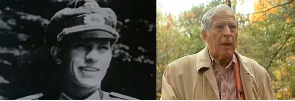
Gies tijdens en na de oorlog (Still uit de documentaire Battle of Arnhem – Both sides of the line via YouTube)

Verder bezochten we nog een locatie aan de Van Lennepweg waar de bekende foto van een 23 Mortar platoon is gemaakt aan de Van Lennepweg. De mortierput is nog duidelijk te zien.