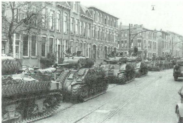
14 april 1944. De 5e Canadese Pantser Divisie overschrijdt op de Hommelseweg in het verlaten Arnhem de startlijn voor operatie "Dutch Cleanser"