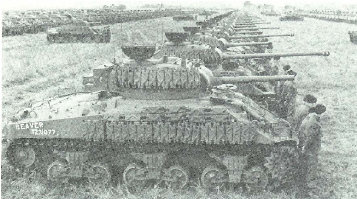
Afscheidsparade op het vliegveld Eelde. Op de voorgrond het B-squadron. Duidelijk is te zien dat de ene helft van de SHERMANS is uitgerust met 75 mm kanonnen en de andere helft met 17-ponder kanonnen met hun langere loop.

Ook was geen opheldering te verkrijgen over het feit dat de tank in 1945 op de op-rit naar Huize Hartenstein werd aangetroffen, terwijl zij eigenlijk op de dump op Deelen terecht had moeten komen. Hopelijk komen hierover nog een nieuwe gegevens te voorschijn.