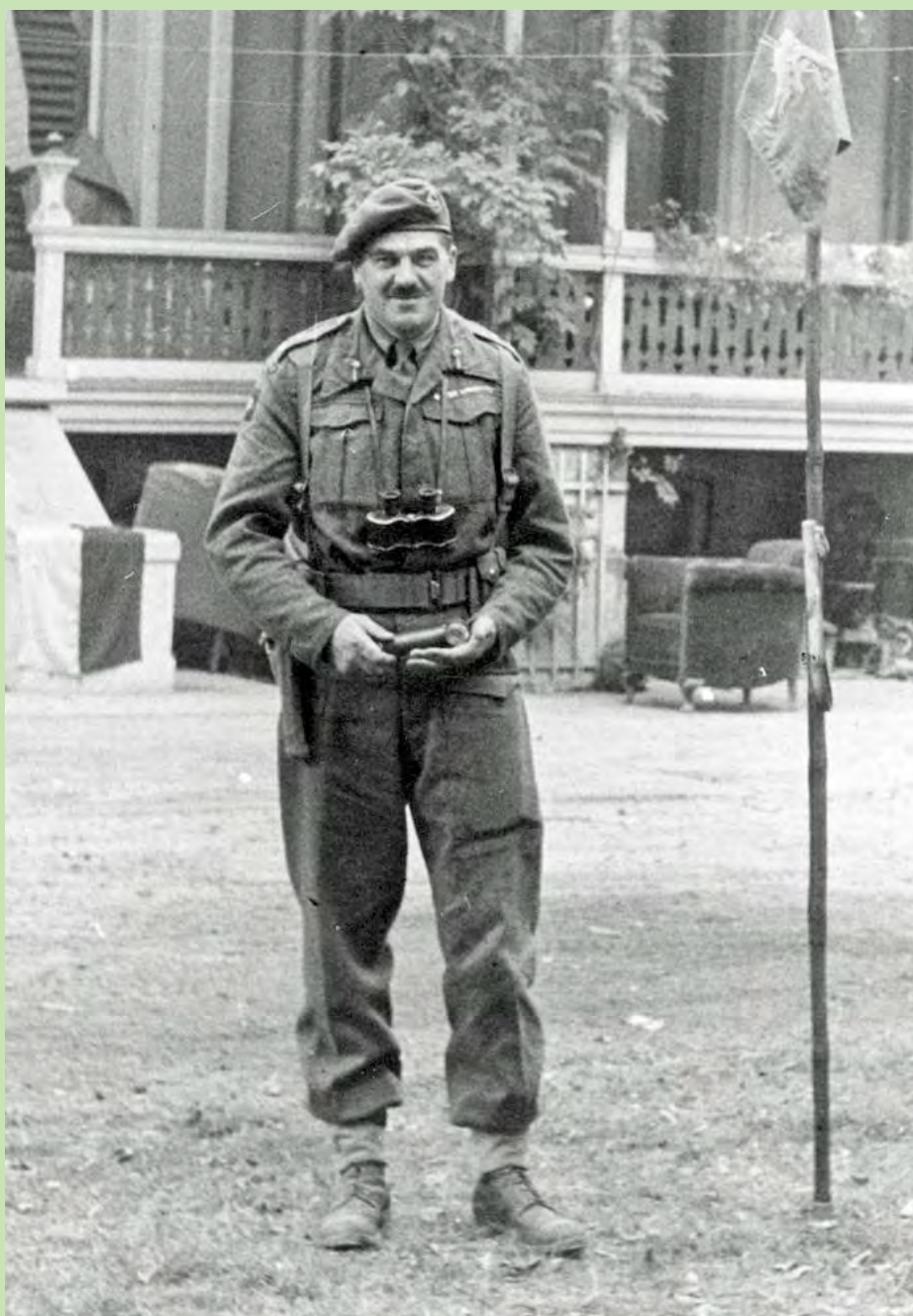
Commandant 1st Airborne Division, Major General Roy Urquhart, kan op maandagavond, als er vier Britse bataljons in Arnhem-west zijn verzameld, geen effectieve leiding geven aan deze strijdmacht. Op nog geen 300 meter van deze eenheden verwijderd moet hij zich gedwongen schuilhouden.