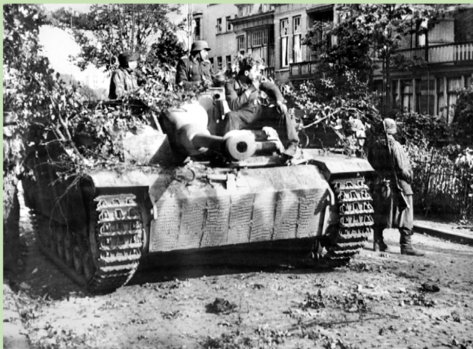
De 10 Sturmgeschütze van Sturmgeschütz Brigade 280 vormen de kern van de Duitse tegenaanvallen op dinsdag 19 sept. Zij zijn op zondagavond van Denemarken onderweg naar Hamburg als ze gederouteerd worden.

Rond 0800 uur voeren de Duitsers de eerste tegenaanvallen uit. Die komen in eerste instantie vanuit zuidoostelijke richting vanuit Onderlangs. Ondersteund door Sturmgeschütze proberen Duitse infanteristen de opstellingen van de B-company van de Staffords via Onderlangs te omvatten. Vanuit de hoger gelegen opstellingen hebben de Staffords inzicht in het lager gelegen Onderlangs. Met PIAT's weten die de aanvallen voorlopig nog af te slaan. Overste McCardie heeft zijn commandopost inmiddels verder naar voren verplaatst tegenover het Van Lingen College.