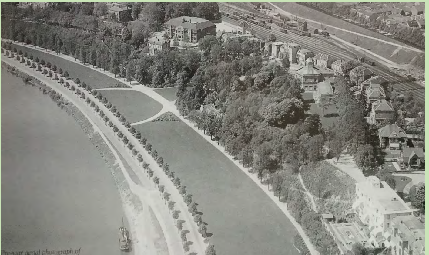
Luchtfoto van Arnhem-west van voor de oorlog. Linksonder het Elisabeth's Ziekenhuis, daarachter de spoorlijn en op de voorgrond het laaggelegen Onderlangs. De huizenrij ten zuiden van het spoor is gelegen aan de Utrechtseweg, oftewel Bovenlangs.

zondagavond halt te laten houden gedurende de nacht is wellicht de belangrijkste. Hoewel hij zich als commandant voorin bevindt, beschikt hij op dat moment niet over de beste SA en volgt adviezen van zijn ondercommandanten niet op. Ook het tijdsverlies als gevolg van de misverstanden, orders en tegenorders in de nacht van maandag op dinsdag, is een direct gevolg van het ontbreken van SA. De planning en leiding over de operatie wordt niet vanuit Arnhem-west maar door de waarnemend divisiecommandant vanuit Hartenstein ge-